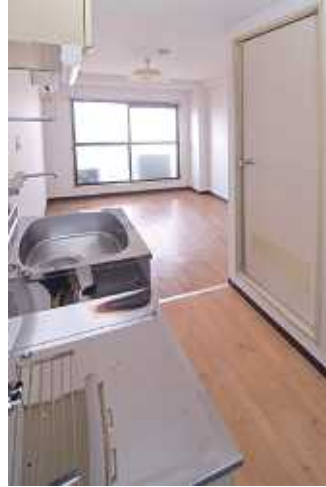
▶ 日当たりの良いワンルーム