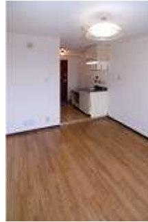
▶ 収納付きキッチン